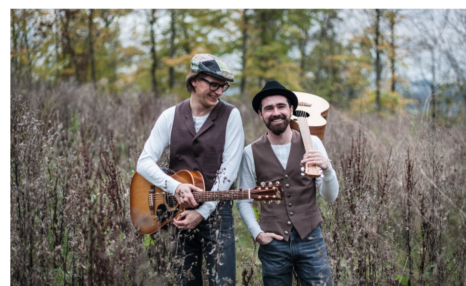
Bolz & Knecht